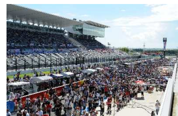
ピットウォークイメージ

※小学生以下のお子さまは、無料でご参加いただけます(お子さまお一人でのご入場はできません)