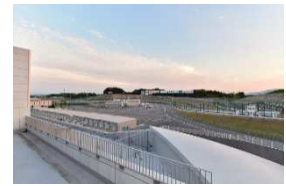
ホスピタリティテラス “Special”からの眺望イメージ(ストレート/S字コーナー)