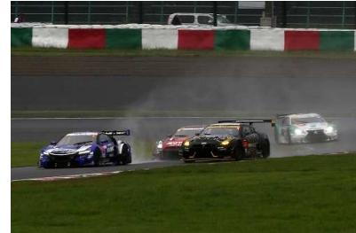
雨のなかスタートした昨年のSUZUKA1000km

昨年は雨のなかスタートし、序盤からトップが何度も入れ替わる展開が観客を沸かせました。その後、雨がやみコースが徐々に乾き始めると、雨用から晴れ用のタイヤへ変えるタイミングが各チームによって異なり、その判断が明暗を分けました。今年も、SUZUKA1000kmでしか見られない、ドラマチックな展開が期待されます。