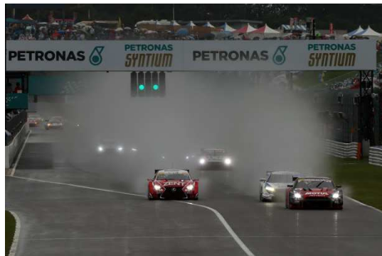
2015年のSUZUKA1000km スタートシーン

なお、前売チケットは6月18日(土)より鈴鹿サーキットの窓口で、19日(日)より鈴鹿サーキットオンラインショッピングサイト「MOBILITY STATION」、プレイガイド、コンビニエンスストアで発売いたします。