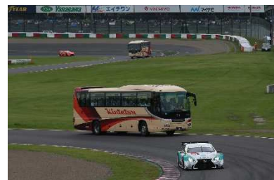
※サーキットサファリイメージ