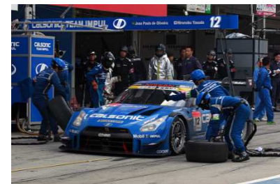
今年のSUPER GTではセーフティカー導入中のピット作業が禁止される ※写真はイメージです

このように、今シーズンのSUZUKA1000kmではレギュレーションの改訂がレース展開に大きな影響を与えることが予想され、より予測不能でエキサイティングなレースになることが期待されます。