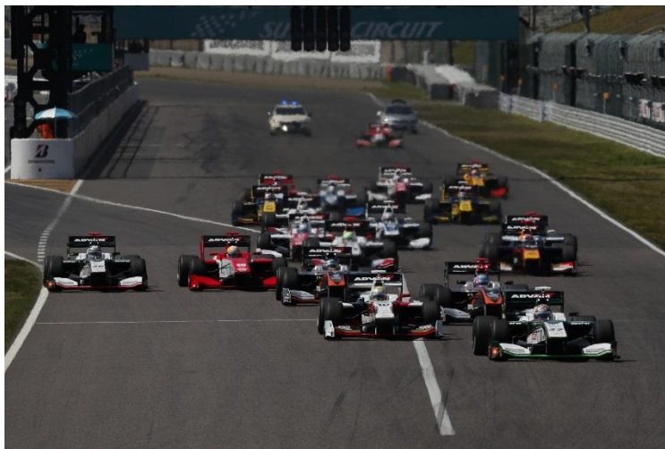
2017年第1戦(鈴鹿)のスタートシーン

なお、本レースの前売チケットは、8月13日(日)より販売を開始し、決勝日当日はゆうえんちモトピアパスポート(大人4,300円 子ども3,300円 幼児2,100円)でも観戦いただけます。