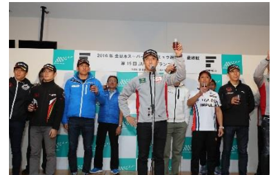
昨年シーズンのシーズンエンドパーティーの様子