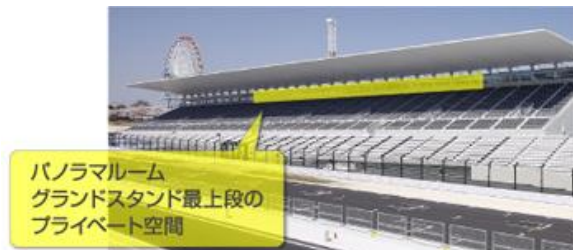
パノラマルーム グランドスタンド最上段の プライベート空間

■パノラマルーム (2日間有効 ※別途観戦券が必要) パノラマルームはグランドスタンド最上段のプライベート空間。エアコン付きの個室で、周囲を気にせずゆったりとご観戦いただけます。大型サーキットビジョンと合わせて、専用モニターでもお楽しみいただけます。また、さまざまな観戦エリアでお楽しみいただく際の荷物保管スペースとして、お子様とご一緒のご家族やグループでの観戦にもおすすめです。特典としてピットウォークに参加することができます。