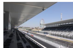
ホスピタリティテラス バルコニー席からの眺め

※ご購入には観戦券が別途必要です ※ホスピタリティラウンジ(ピットビル2階)にはご入場いただけません ※前売りパドックパス完売の場合、当日パドックパスは販売いたしません