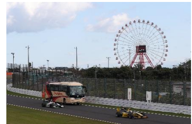
昨年のサーキットサファリの様子