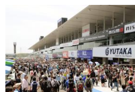
ピットウォーク(イメージ)

※数に限りがございます。完売の際はご了承ください ※ピットウォークには、脚立・傘の持ち込みはできません ※ピットウォークは、予告なく時間の変更、または中止となる場合がございます ※小学生以下のお子様おひとりでは入場いただけません