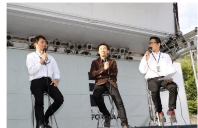
昨年のトークショーの様子