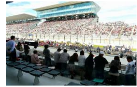
ホスピタリティラウンジ室内 屋外テラス