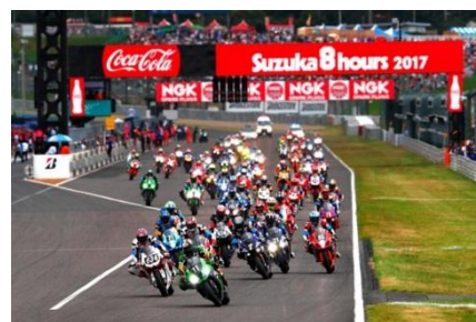
2017年のスタートシーン